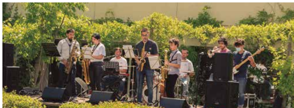
Una de les actuacions de l'anterior temporada de l'Escena & Llibres