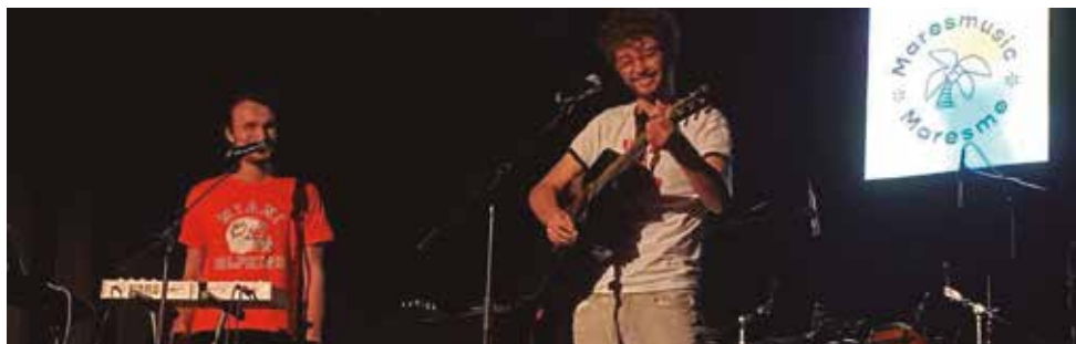
El grup vilassarenc Palmera, un dels finalistes