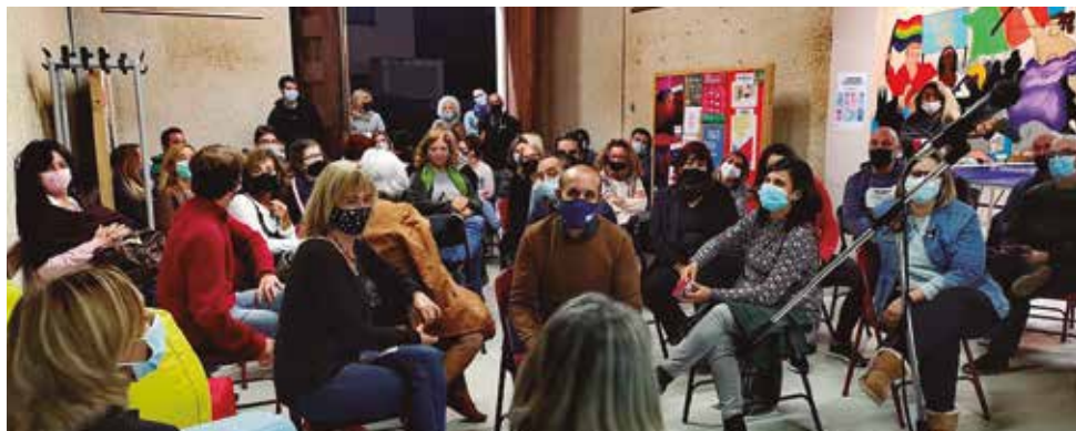
2 de novembre, jornada de presentació del nou espai

Des del 6 de novembre, Vilassar de Mar compta amb un nou espai inclusiu destinat als joves amb diversitat funcional intel·lectual. S'anomena L'Altre Espai Jove, s'ubica a Can Jorba i és d'accés lliure i gratuït, els dissabtes de 16 a 21 h.