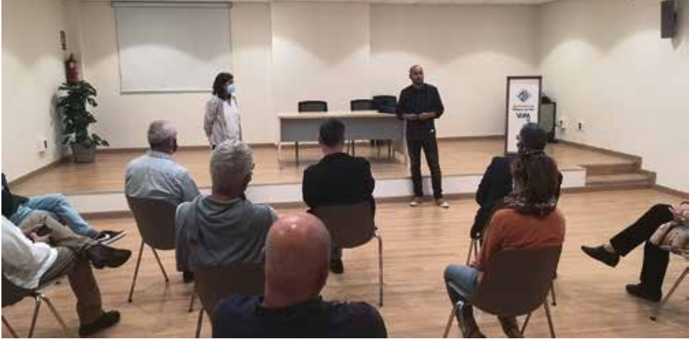
L'alcaldé i la regidora de Serveis Socials i Gent Gran, a la inauguració