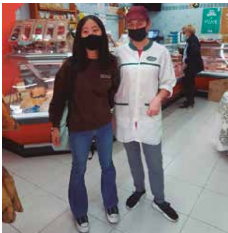
Una de les alumnes, al taller de Can Pocurull

Enguany, l'oferta de tallers inclou els següents: taller de serveis (brigada d'obres i serveis), jardineria (brigada